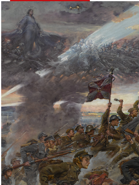
Fragment obrazu Jerzego Kossaka „Cud nad Wisłą”. Ze zbiorów Zamku Królewskiego w Warszawie – Muzeum.

Kiedy w sierpniu 1920 r. u wrót stolicy stanęli bolszewicy, Matka Boska Łaskawa była dla warszawiaków źródłem nadziei i wiary w zwycięstwo, co przedstawił Jerzy Kossak na obrazie „Cud na Wisłą”. Tysiące żołnierzy wyruszało na front z Jej wizerunkiem, a niezliczone rzesze Polaków połączyła modlitwa w intencji zwycięstwa. Dla „pokrzepienia ducha i wzmocnienia serc wiernych, na ubłaganie pomocy Nieba” odmawiano także litanie do Najświętszego Serca Pana Jezusa oraz bł. Andrzeja Boboli i bł. Władysława z Gielniowa.