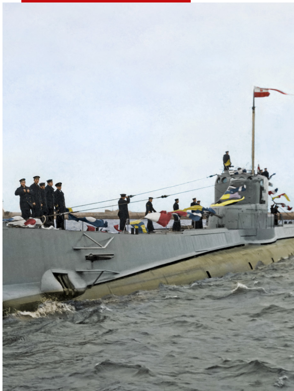
ORP „Orzeł” wpływa do portu w Gdyni. 10 lutego 1939 r.

Okręt Rzeczypospolitej Polskiej „Orzeł” powstał w 1938 r. w stoczni holenderskiego Vlissingen. Budowę sfinansowano w dużej mierze ze składek społecznych zbieranych m. in. przez Ligę Morską i Kolonialną. W tym samym roku zwodowano również drugi okręt tego typu – ORP „Sęp”. Były to wtedy najnowocześniejsze i najsilniej uzbrojone okręty podwodne na świecie.