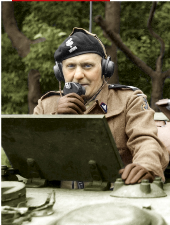
Dowódca 1 Dywizji Pancernej, gen. Stanisław Maczek w wieży swego czołgu Cromwell.

1 Dywizję Pancerną powstała w Wielkiej Brytanii w 1942 r. z inicjatywy gen. Stanisława Maczka, który był jej dowódcą do rozformowania w 1947 r. Kontynuowała tradycje 10. Brygady Kawalerii Zmotoryzowanej z wojny obronnej w 1939 r. oraz 10. Brygady Kawalerii Pancernej z kampanii francuskiej w 1940 r.