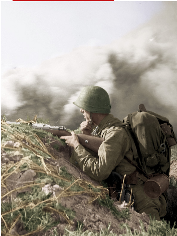
Żołnierz piechoty Wojska Polskiego II Rzeczypospolitej.

Po odzyskaniu niepodległości rozkazem z 1919 r. ujednolicono umundurowanie wojsk lądowych, w tym wygląd orzełka wojskowego. Wykonywany był z ciemno oksydowanej blachy lub wyszywany szarobiałą nicią na podkładkach barwy nakrycia głowy. Jego cechy to: 5 cm wysokości, rozpostarte do lotu skrzydła, głowa zwrócona w prawo oraz zamknięta korona z krzyżem. Do 1928 r., na tarczy amazońki wybijano numer pułku lub nazwę broni. Orła bez tarczy noszono na patkach mundurów generalskich oraz na guzikach. Oficerowie Sztabu Generalnego mieli również znak orła na kołnierzach kurtek. Przywilejem weteranów powstania styczniowego (od początku 1920 r.) był orzełek z wypukłą, złożoną literą „W” na piersi oraz również złożoną datą „1863” na tarczy amazońki.