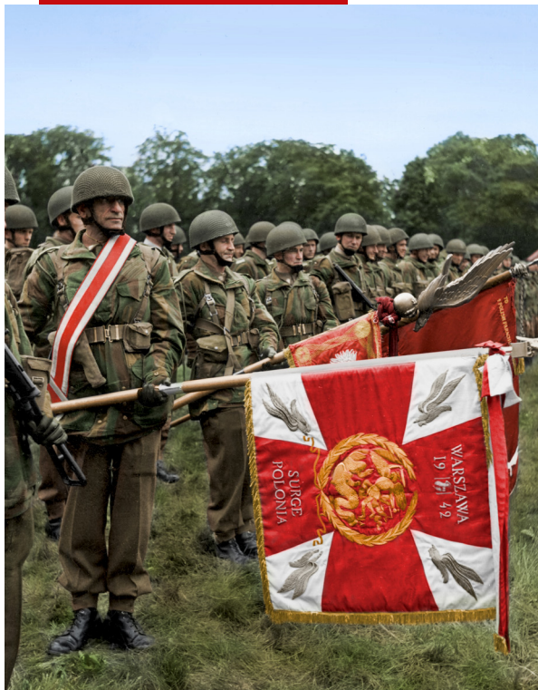
Sztandar 1 Samodzielnej Brygady Spadochronowej. Widoczne symbole Znak Spadochronowego.

„Cichociemni” to żołnierze Polskich Sił Zbrojnych, którzy byli desantowani z Wielkiej Brytanii do okupowanej Polski podczas II wojny światowej w celu prowadzenia walki z okupantami i przygotowywania powstania powszechnego. Wyróżniali się wszędzie wyszkoleniem, hartem ducha i niezłomnym patriotyzmem. Wzbudzali też szczególny strach u okupantów.