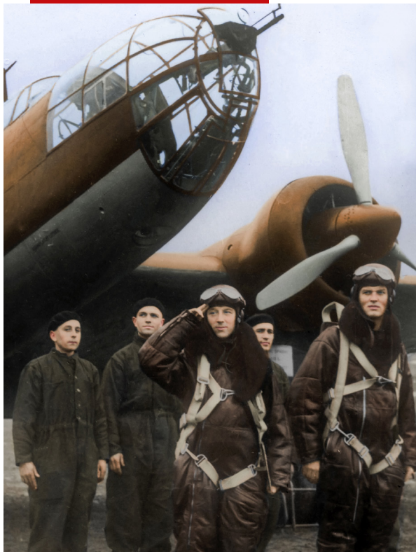
Zaloga samolotu PZL-37 Łoś z 217. Eskadry Bombowej przy maszynie. Fot. domena publiczna; koloryzacja: Mikołaj Kaczmarek.

Godłem Lotnictwa Wojskowego II Rzeczypospolitej jest od 1936 r. biały orzeł, otoczony stylizowanymi skrzydłami husarskimi, trzymający w szponach tarczę amazonek. Orzełek oficerski haftowano nićmi metalowymi, oksydowanymi na stare srebro, na usztywnionej podkładce sukiennej. Orzełek szeregowców wykonywano z białego metalu i również oksydowano. Godło nawiązywało do „skrzydlatych rycerzy”, jak niekiedy nazywano husarzy w Rzeczypospolitej Obojga Narodów.